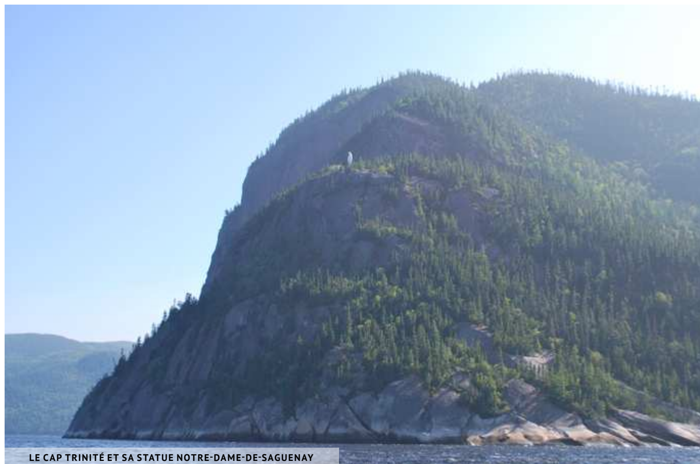
LE CAP TRINITÉ ET SA STATUE NOTRE-DAME-DE-SAGUENAY

randonnée, vous garantit des vues saisissantes sur le Fjord du Saguenay. Trois itinéraires aménagés avec des câbles sont proposés, d'une durée de 3, 4 ou 6 heures et de niveau de difficulté intermédiaire à avancé. Le parcours se fait accompagné d'un guide. Il faut être âgé de 12-14 ans minimum. Ouvert du début juin à la mi-octobre.