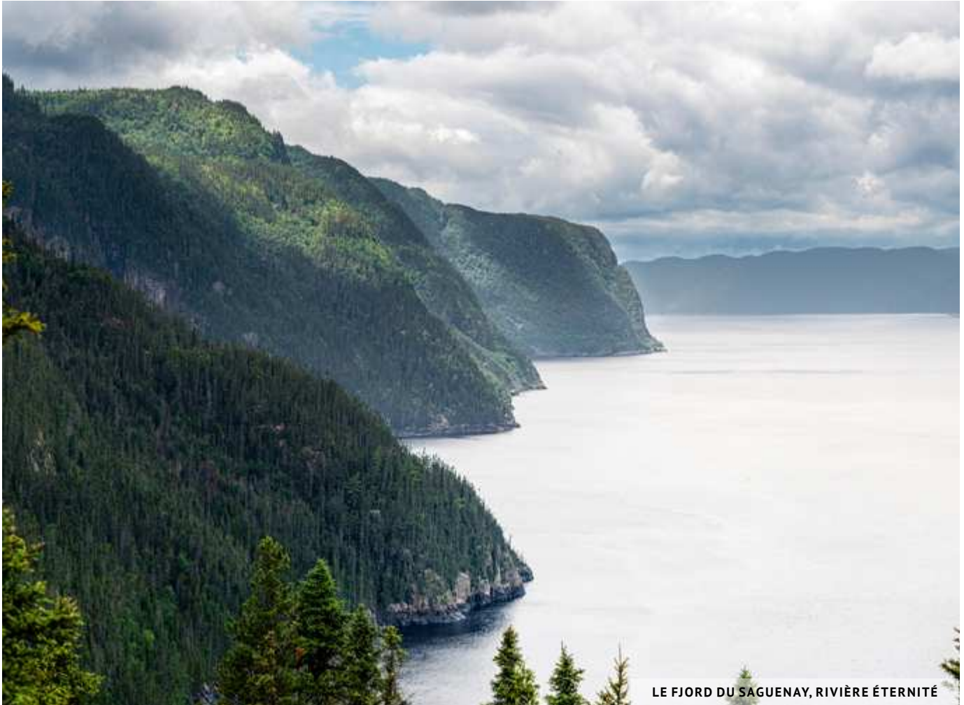
LE FJORD DU SAGUENAY, RIVIÈRE ÉTERNITÉ