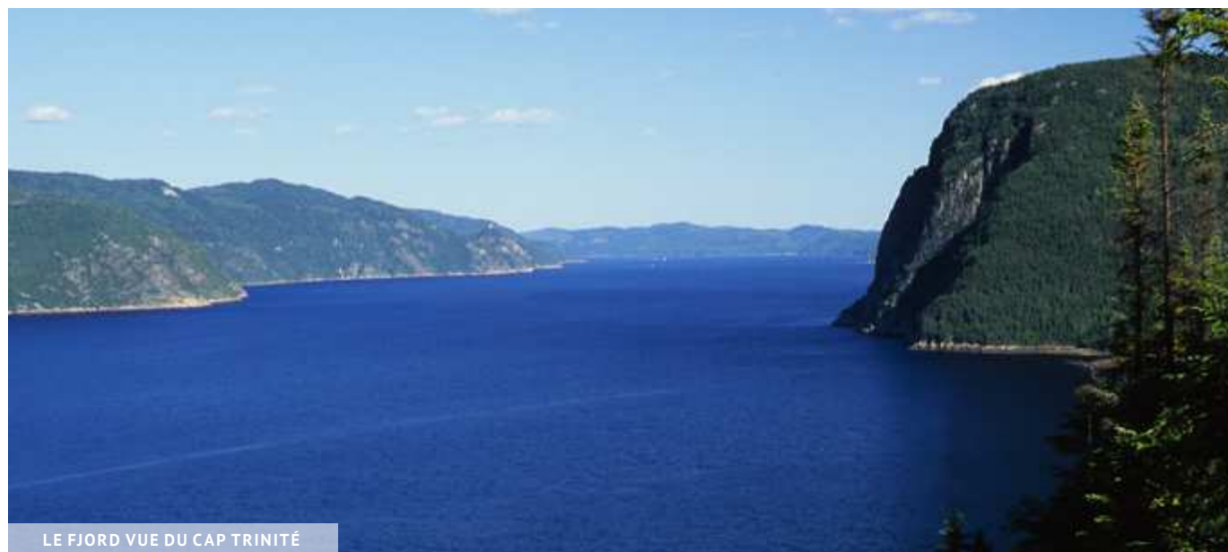
LE FJORD VUE DU CAP TRINITÉ