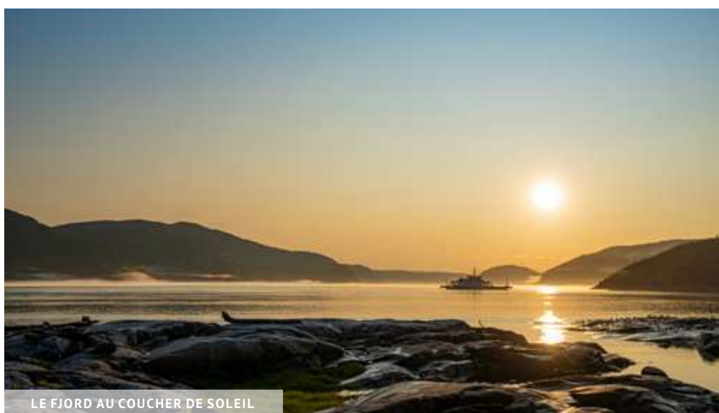
LE FJORD AU COUCHER DE SOLEIL