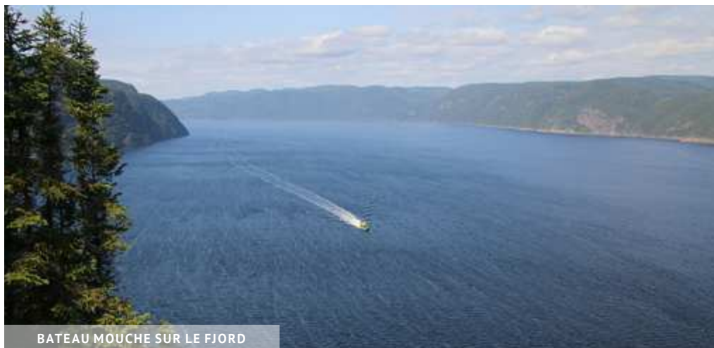
BATEAU MOUCHE SUR LE FJORD