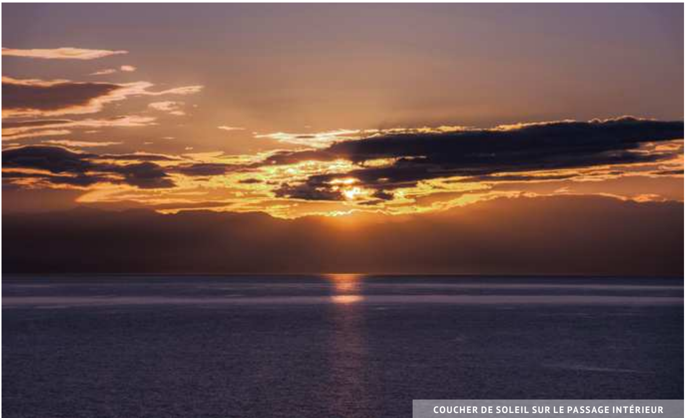
COUCHER DE SOLEIL SUR LE PASSAGE INTÉRIEUR