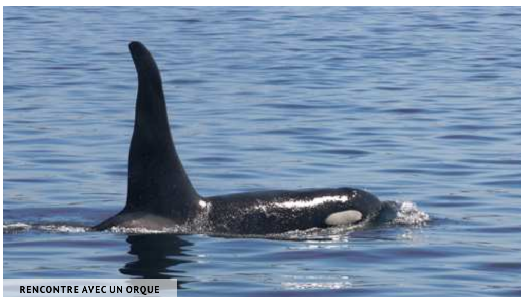
RENCONTRE AVEC UN ORQUE