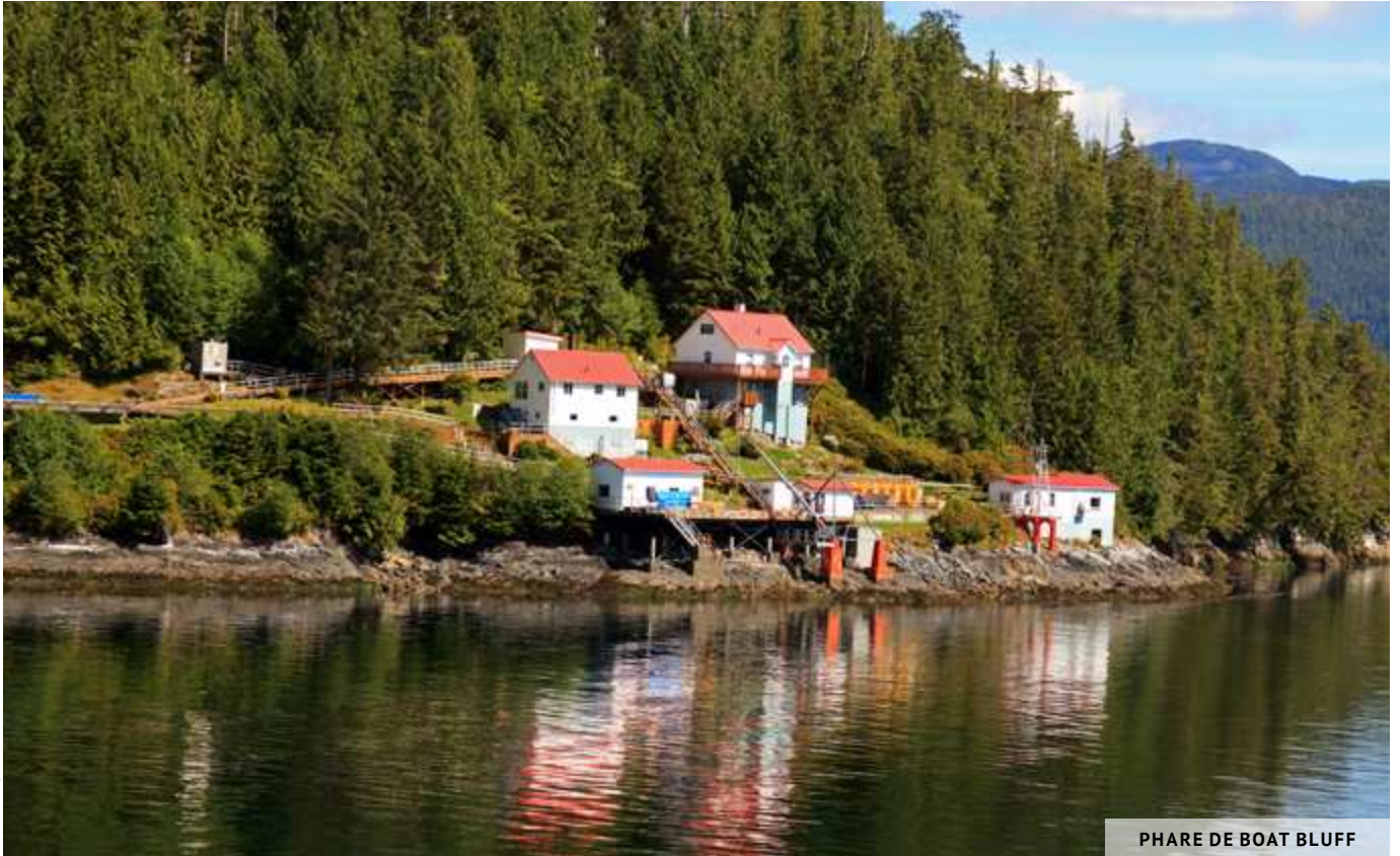
PHARE DE BOAT BLUFF