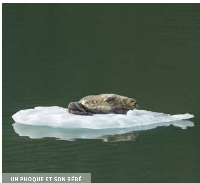
UN PHOQUE ET SON BÉBÉ