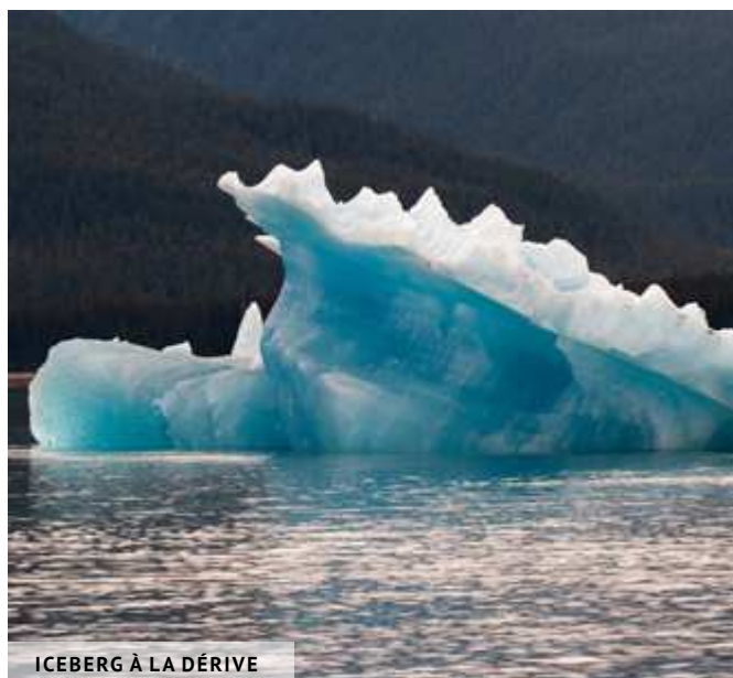
ICEBERG À LA DÉRIVE